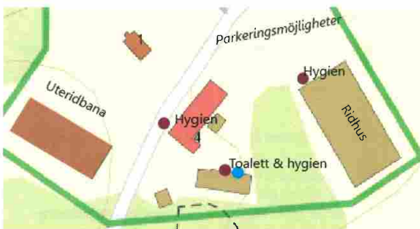
Karta 1 (Stallet stängt för obehöriga, station är utanför entrén)

8. Evenemanget kortas ner så mycket det går, men prioriteringen kommer vara att se till att färre än 50 personer befinner sig på samma plats vid samma tidpunkt.